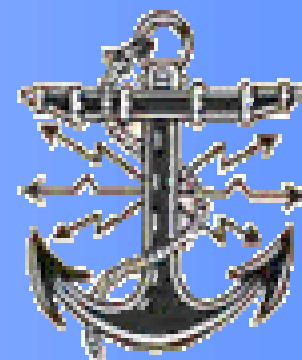
Marine Funker Club Austria

1500 bis 1530 Automatic Identification System